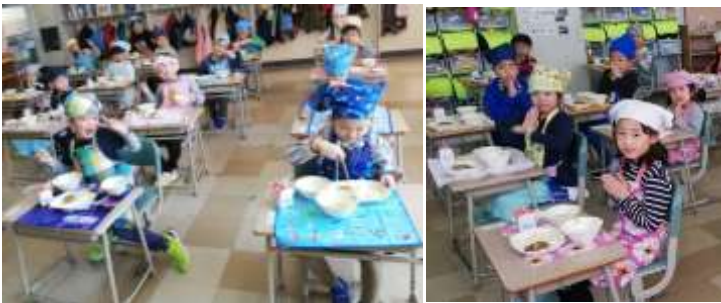
1組も2組もお行儀よく、約束を確認してから食べました。

小学校に入学し初めての給食でした。給食にはたくさんの約束があるのですが、それを先生と確認した後、「いただきます」をしました。給食がみんな楽しみだったので笑顔がたくさん見られました。